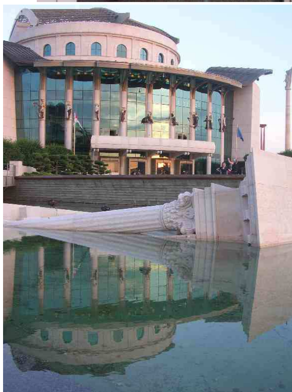
A Nemzeti Színház,